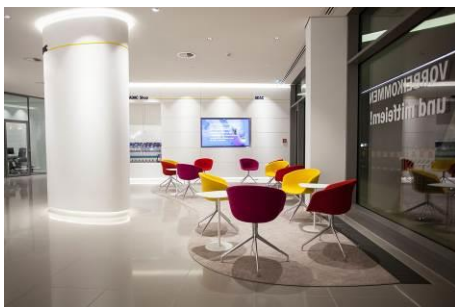
Rosskopf + Partner_ADAC_6.jpg

Die Stühle der Lounge sowie die Auslagen setzen frische Farbakzente. Das restliche Mobiliar tritt in puristischem Weiß dezent zurück und verleiht dem Kundencenter ein stilvolles Ambiente.