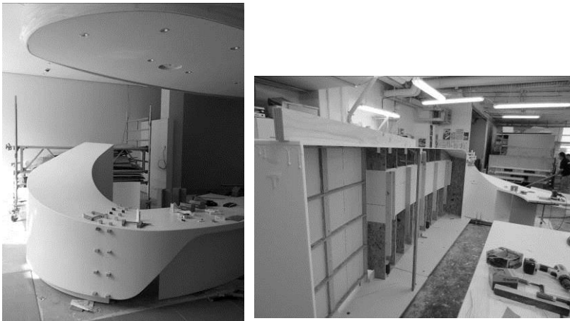
Rosskopf + Partner_ADAC_5a+b.jpg

Über 50 Einzelteile haben Rosskopf + Partner zusammen mit der Möbelwerkstätte Schumann millimetergenau zusammengefügt, verklebt und anschließend verschliffen. Das tragende Skelett der Tresen bilden Spanten-Rahmen-Konstruktionen aus Multiplexplatten.