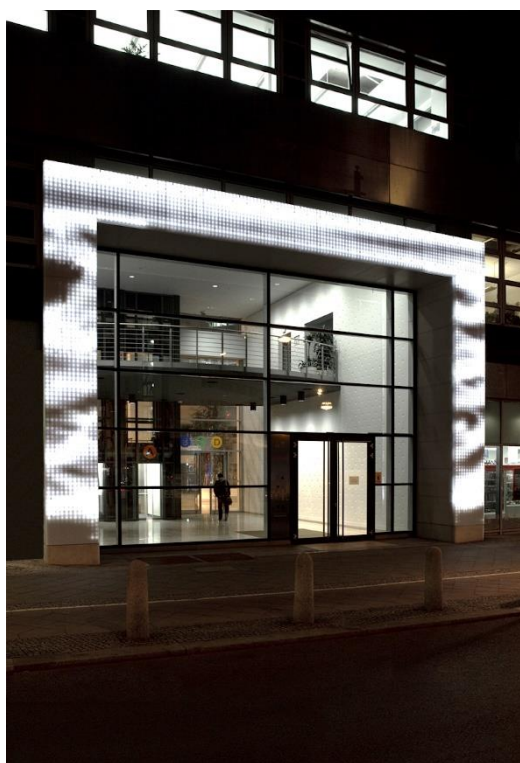
Rosskopf + Partner_Schönhauser Tor_2