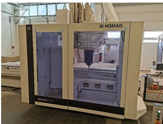
Die CNC-Maschine in Betrieb: Das Werkzeug wird positioniert.