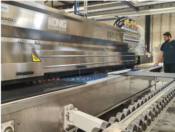
Die neue Kantenschleifmaschine in Aktion: Alle 40 cm kann neues Material eingelegt werden.