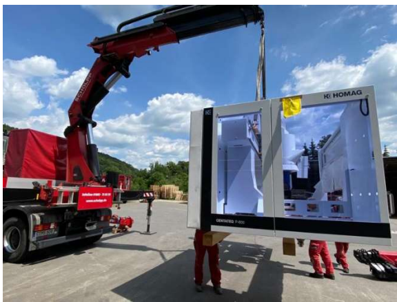
Anlieferung der neuen 5-Achs-CNC in Hennersdorf.